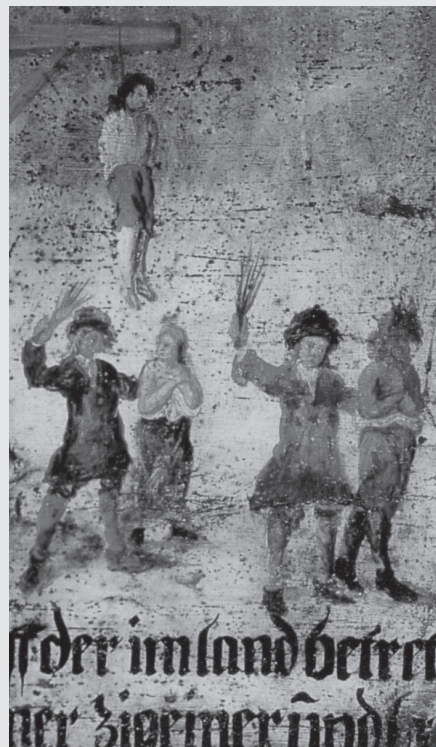
III. 5 (Detail) Výstražné tabule umiestnené na hrani- ciach Svätej ríše rímskej, ktoré Rómov upozorňovali na zákaz vstupu, 1715. (Asséo, Henriette 1994: Les Tsiganes. Une destinée eu- ropéenne. Paris: Gallimard, str. 37)